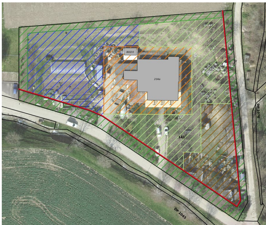
Figure 2 : Aires définies sur la parcelle 141. Orange : constructions principales, bleu : production maraîchère, brun : couverts et stockage, pistache : couche, pépinière et de verger, vert : transition paysagère. En rouge, les nouvelles limites des constructions.