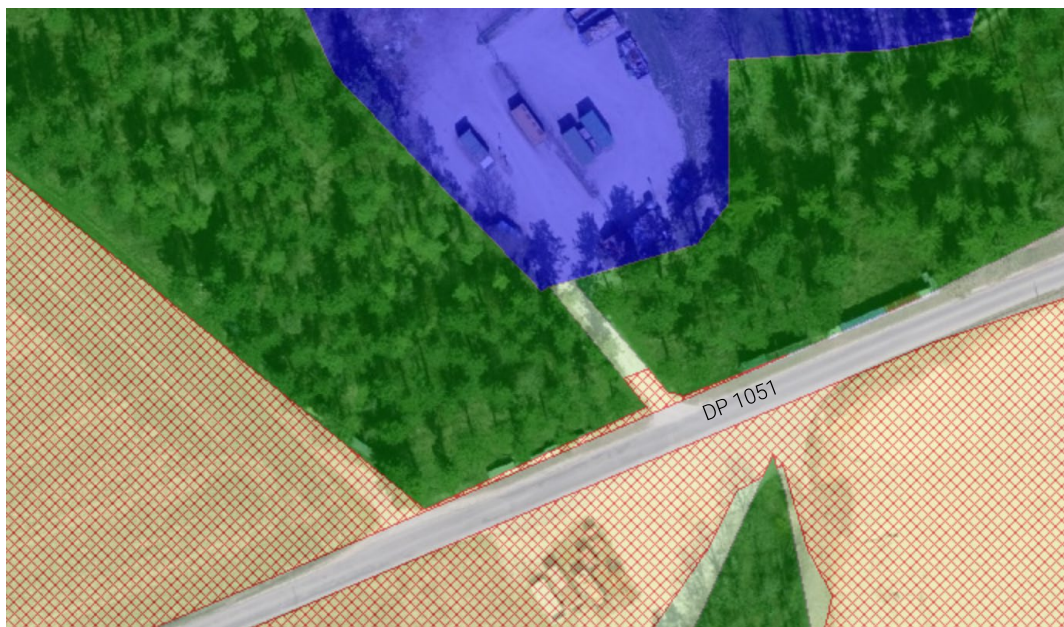
Figure 3 : Extrait geo.vd.ch – Affectation en vigueur et couche SDA

A noter que cette modification engendre indirectement une réduction des surfaces d'assolement. Comme le montre l'extrait du guichet cartographique cantonal ci-dessous, la couche officielle SDA inclut une minuscule bande entre le DP 1051 et l'aire forestière ainsi que le début de l'accès que le présent dossier propose d'affecter en zone affectée à des besoins publics B (env. 30 m 2 ).